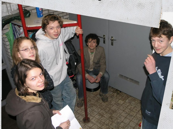
Wilde Vaert - 2009