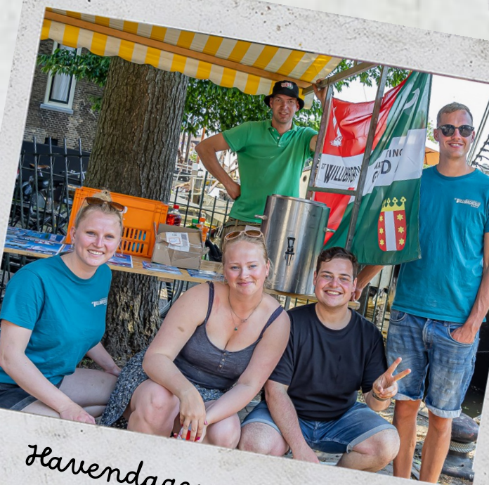
Havendagen - 2023