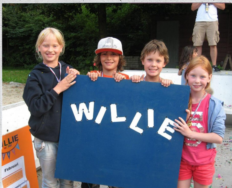
Welpenkamp - 2013