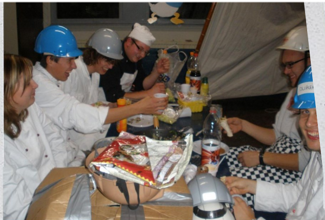
Verkenners - 2009