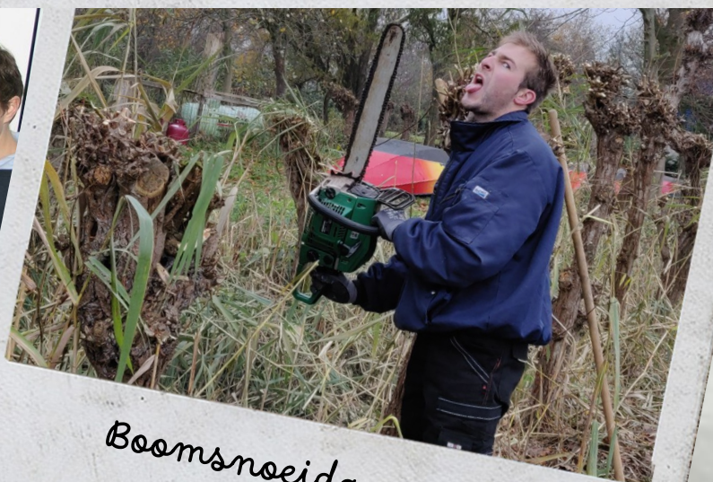
Boomsnoeidag - 2018